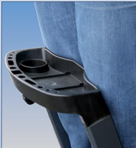
Ergonomisch geformte Ablageschale für bequemerer Arbeiten