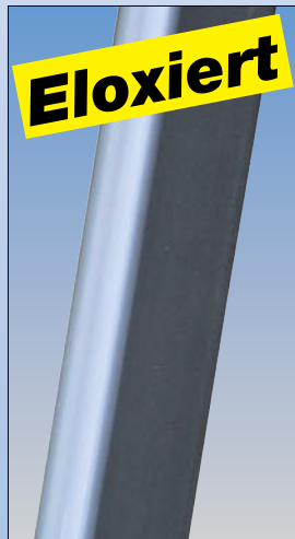
Eloxierte Steig- und Stützholme verhindern das Verschmutzen der Hände