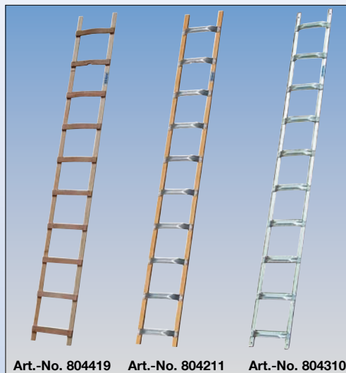
Art.-No. 804419 Art.-No. 804211 Art.-No. 804310