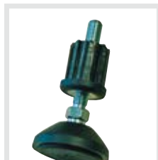
Höhenverstellbare Fußplatte als Sicherheitszubehör erhältlich